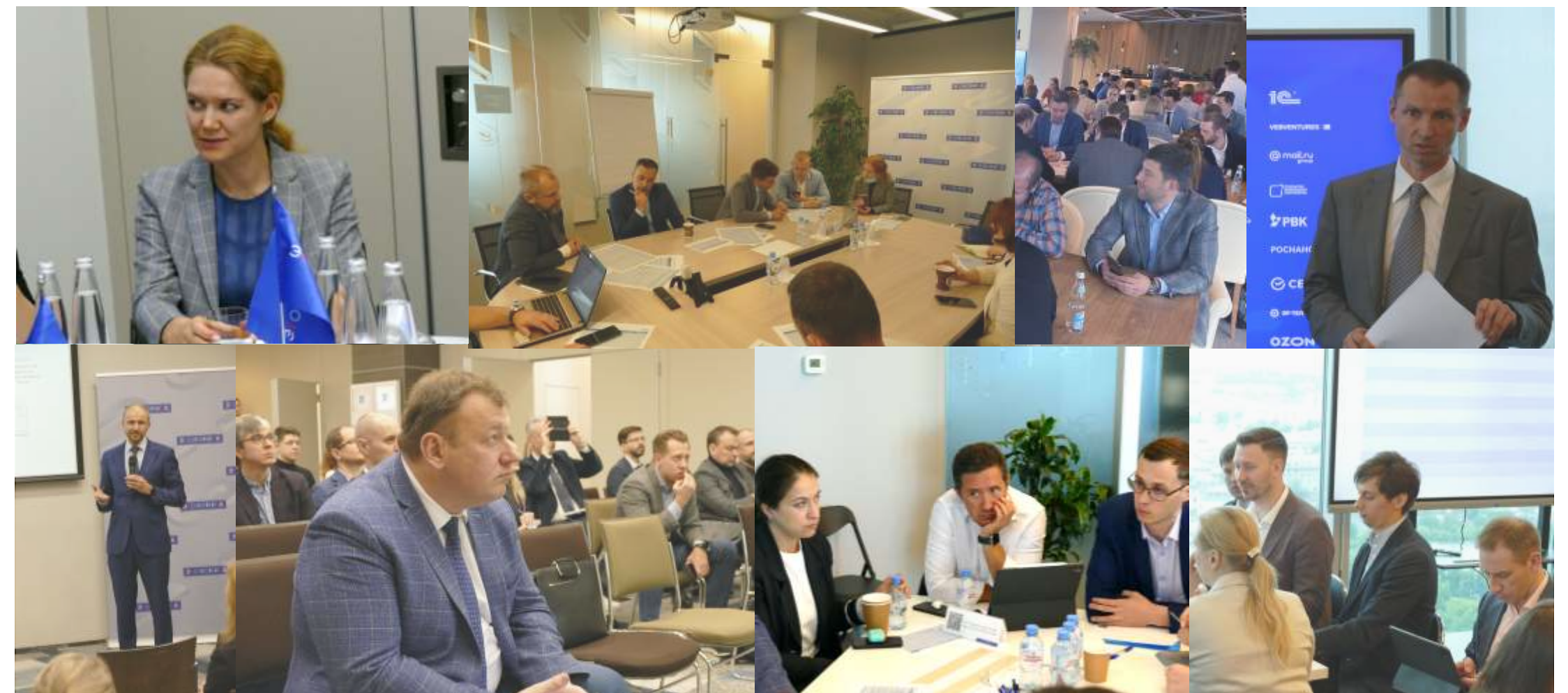
Затрачено более 500 человеко-часов